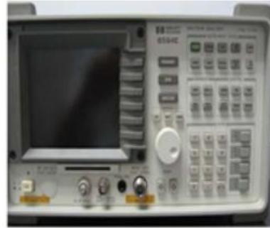
HP 8594E 频谱分析仪